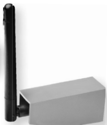
antena 434MHz - opcja