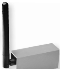
antena 434MHz - opcja