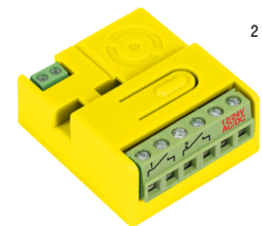
NW2_L1 2 kanały - 24 piloty