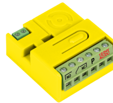
NW1_L1 1 kanał - 30 pilotów

najmniejsze sterowniki na rynku o niespotykanych możliwościach, 12-24V AC/DC, Proxima jest niezależnym producentem automatyki bram i rolet. Nazwy innych producentów zostały wymienione wyłącznie w celu wyjaśnienia przeznaczenia produktu Proxima.