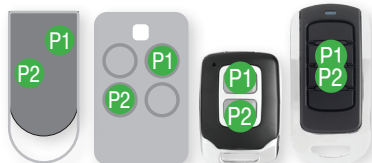
Amigo Kilo Mini Banan

Każdy przycisk pilota MASTER systemu Genius zawiera numer wjazdu. Numer wjazdu można w pilocie wylosować. Przycisk MASTER pilota Genius może radiowo, w specjalnym procesie rejestracji, przestać kanałowi odbiornika Genius numer swojego wjazdu. Przycisk pilota MASTER Genius może również radiowo, w specjalnym procesie rejestracji, przestać dowolnemu przyciskowi innego pilota Genius numer swojego wjazdu.