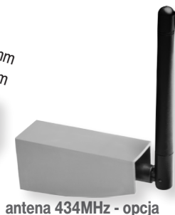
antena 434MHz - opcja