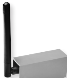
antena 434MHz - opcja